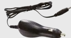
Adaptateur pour allume-cigare Permet de recharger l'imprimante dans un véhicule.