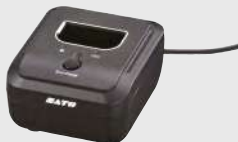
Chargeur de batterie 1 voie Recharge une batterie intelligente en 3 heures.

Il suffit de brancher l'adaptateur secteur dans l'imprimante pour effectuer la recharge entre deux utilisations. L'imprimante reste fonctionnelle pendant la recharge.