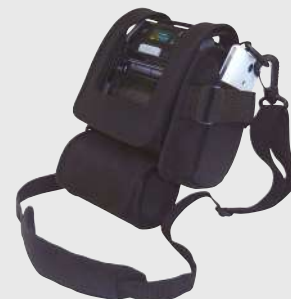
Étuis de transport

Des bandoulières sont disponibles en option comme solution mains libres.