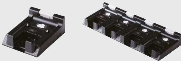
Station d'accueil de recharge 1 emplacement/ 4 emplacements

Forme compacte permettant une utilisation murale, dans un véhicule etc. L'imprimante reste fonctionnelle pendant la recharge et donne une indication claire de l'état de la charge.